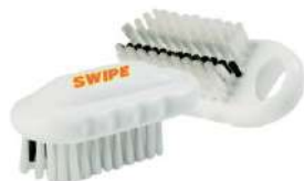
CEPILLO PARA MANOS Y UÑAS