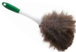
SACUDIDOR DE PLUMAS

Bastón ajustable hasta 2.13m Cabezal flexible 45.7cm