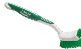
CEPILLO PARA COCINA