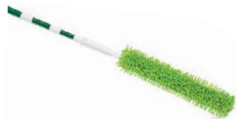
SACUDIDOR ABANICO DE TECHO

Bastón ajustable hasta 2.13m Cabezal flexible 45.7cm