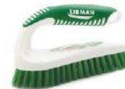
CEPILLO TIPO PLANCHA