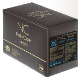
Caja c/30 sobres de 20g Limón Caja c/30 sobres de 20g Vainilla