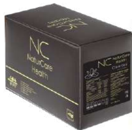
Caja c/22 sobres de 30g