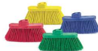
ESCOBA CÓDIGO DE COLOR

Bastón de 1.4 m Rosca 7/8" Repuesto cepillo clásico