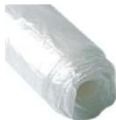
BOLSAS DE BASURA (Alta Densidad)