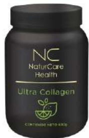
Bote 600g Sabor Limón Bote 600g Sabor Vainilla

Modo de empleo: Una vez al día, mezclar una medida de 20g en un vaso con agua (250ml) a temperatura ambiente. Mezcle hasta disolver totalmente.