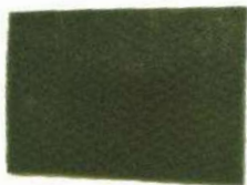
FIBRA VERDE MEDIANA