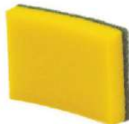
FIBRA VERDE CON ESPONJA