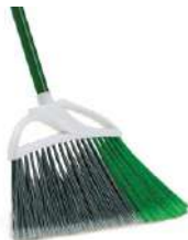
ESCOBA DOMÉSTICA 12"