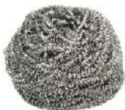
FIBRA ESPIRAL ACERO