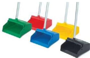
RECOGEDOR DE BASTÓN