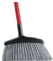
ESCOBA USO RUDO