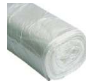
BOLSAS DE BASURA (Alta Densidad)