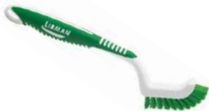
CEPILLO PARA EMBOQUILLADO