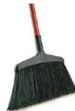
ESCOBA INSTITUCIONAL 15"