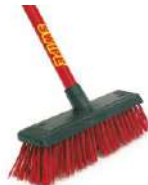
CEPILLO CLÁSICO C/BASTÓN

Bodeguera c/bastón Rosca 7/8" Repuesto escoba bodeguera